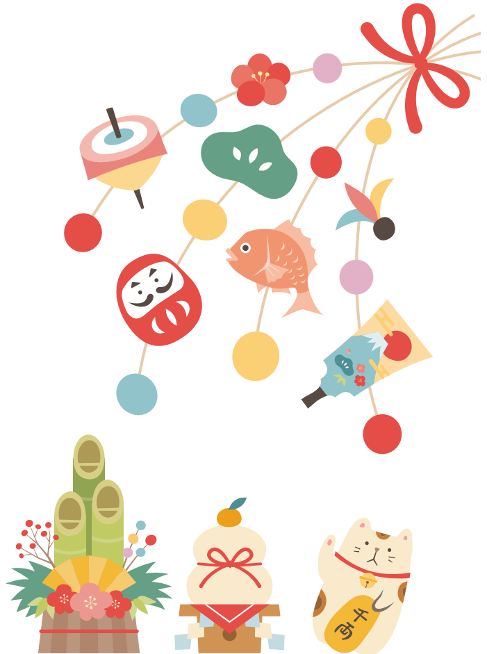
認定 特定非営利活動法人ハートフル福祉募金実績報告書(速報) 単位/円